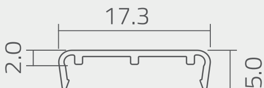
Vista de sección del perfil