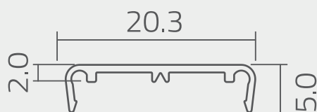
Vista de sección del perfil