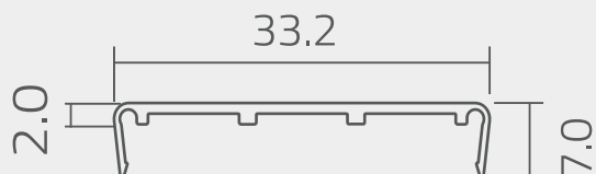
Vista de sección del perfil

Perfiles por pack: 20 un. Peso del pack: 7,02 Kg